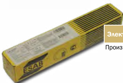
Электроды ESAB Производство Россия.