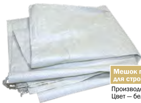
Мешок полипропиленовый для строительного мусора Производство Россия. Цвет – белый.