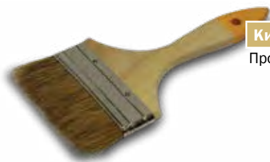
Кисть малярная Производство Китай.