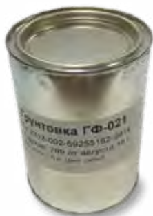
Грунт ГФ-021 Производство Россия.